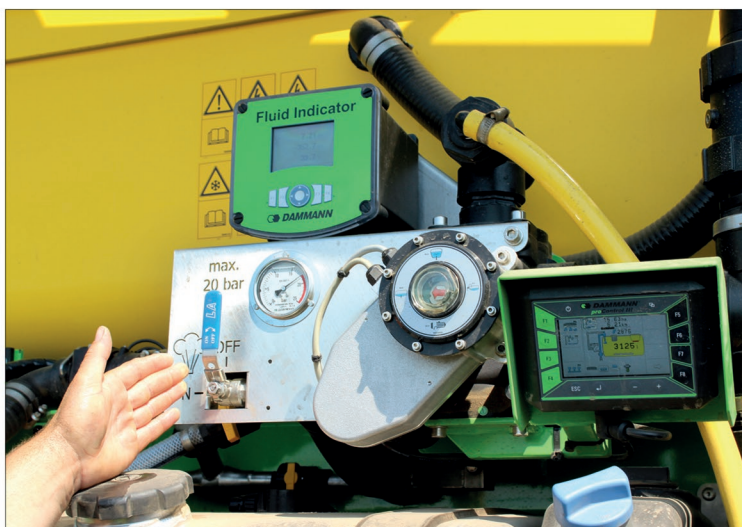
Při přípravě jichy obstuha využije dotykový monitor proControl a Fluid Indicator měřící aktuální pH použité vody

ovládání postřikovače je osvědčený elektronický systém Müller Elektronik, ale výrobce umožní ovládání i jinými systémy (Topcon, John Deere apod.). Přestože jsou postřikovače Dammann sofistikované stroje plné nejmodernějších technologií, vlastní ovládání je jednoduché a uživatelsky přívětivé. Postřikovač je řízen pouze přes dva ventily, jeden v tlakovém a jeden v nasávacím okruhu.