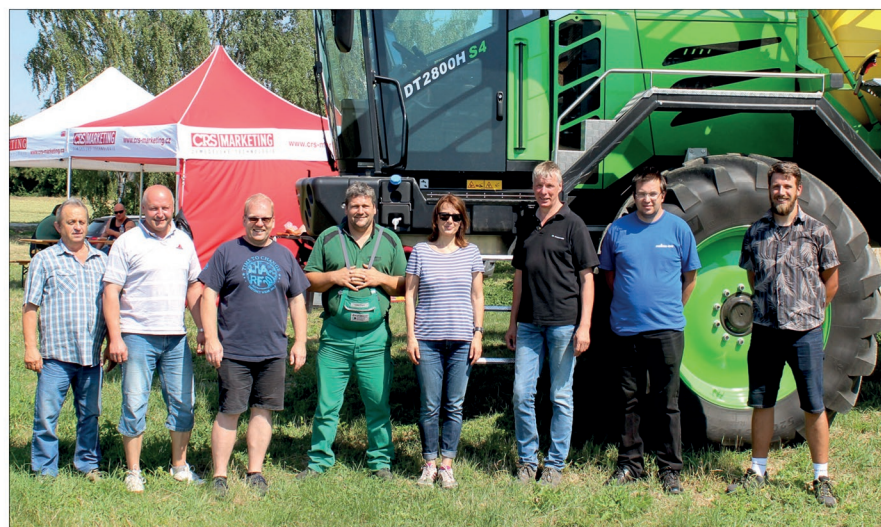
Na Dammann Tour se sešli zástupci výrobce a prodejce s pozvanými zemědělci

K všeobecné oblibě postřikovačů Dammann, především u našich západních sousedů, přispěla jejich robustnost, léty prověřená konstrukce, německá preciznost, snaha vyrábět stroje sice sofistikované, ale z pohledu ovládání co nejjednodušší a v neposlední řadě obrovská výdrž. Ta je výrobcem stanovena na 180 000 až 200 000 ha. Proto postřikovače Dammann získaly pře-