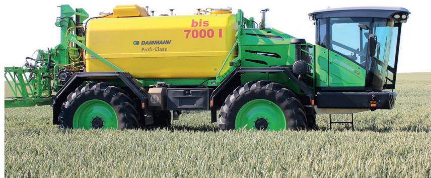
Postřikovače Dammann reprezentují to nejlepší v současné aplikační technice

letištní ranveje. A i v tomto oboru patří k absolutní špičce. Například větší na velkých evropských letištích používá právě techniku Dammann. Protože firma Dammann od počátku vyvíjí a vyrábí pouze postřikovací techniku, je v mnoha ohledech průkopníkem a nositelem nových řešení, která potom často přejímají ostatní výrobci. Příkladem mohou být pneumaticky vypínatelné držáky trysek nebo již patnáct let používaný systém kontroly aplikace v zatáčkách, díky němuž všechny trysky bez ohledu na obvodovou rychlost zajišťují stále konstantní dávku.