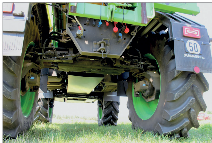
Podvozek má světlou výšku 110 cm a rozchod kol 225 cm

A právě posledně jmenovaný model Dammann DT 2800H S4 se zúčastnil Dammann Tour. Výrobní program však netvoří pouze polní postřikovače, Dammann je specialistou i na postřikovače do speciálních kultur, například jahod, ovoce, zeleniny nebo vánočních stromků.